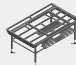
HT 2000 E