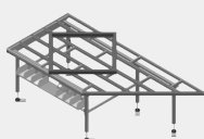
HT 2045 L